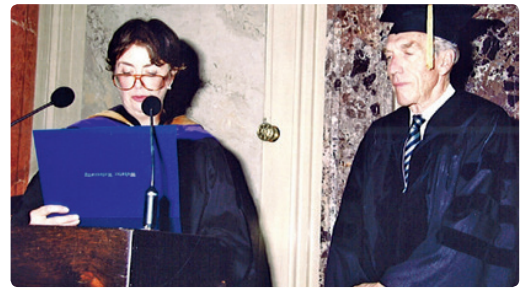
2004 mit österreichischen Kolleginnen am MRI in Palo Alto, 1997 beim Büchersignieren am IST in Wien und 1999 bei der Verleihung des Ehrendoktorats der Webster University während seines letzten Wienaufenthalts.

nun aber durch das Gefühl des verlorenen Paradieses noch leuchtender gemacht. Und ihr folgte wiederum die Leere. Er fühlte sich verraten, betrogen, ausgestoßen. Hätte er an Gott geglaubt, so hätte er Ihn beschuldigt, ihn nicht heimkommen zu lassen. Als Atheist dagegen liebäugelte er gelegentlich mit der Patentlösung des Selbstmordes, denn seine Zweifel wuchsen, bis sie alles zu überwuchern und zu ersticken schienen. Wozu also weiterleben?